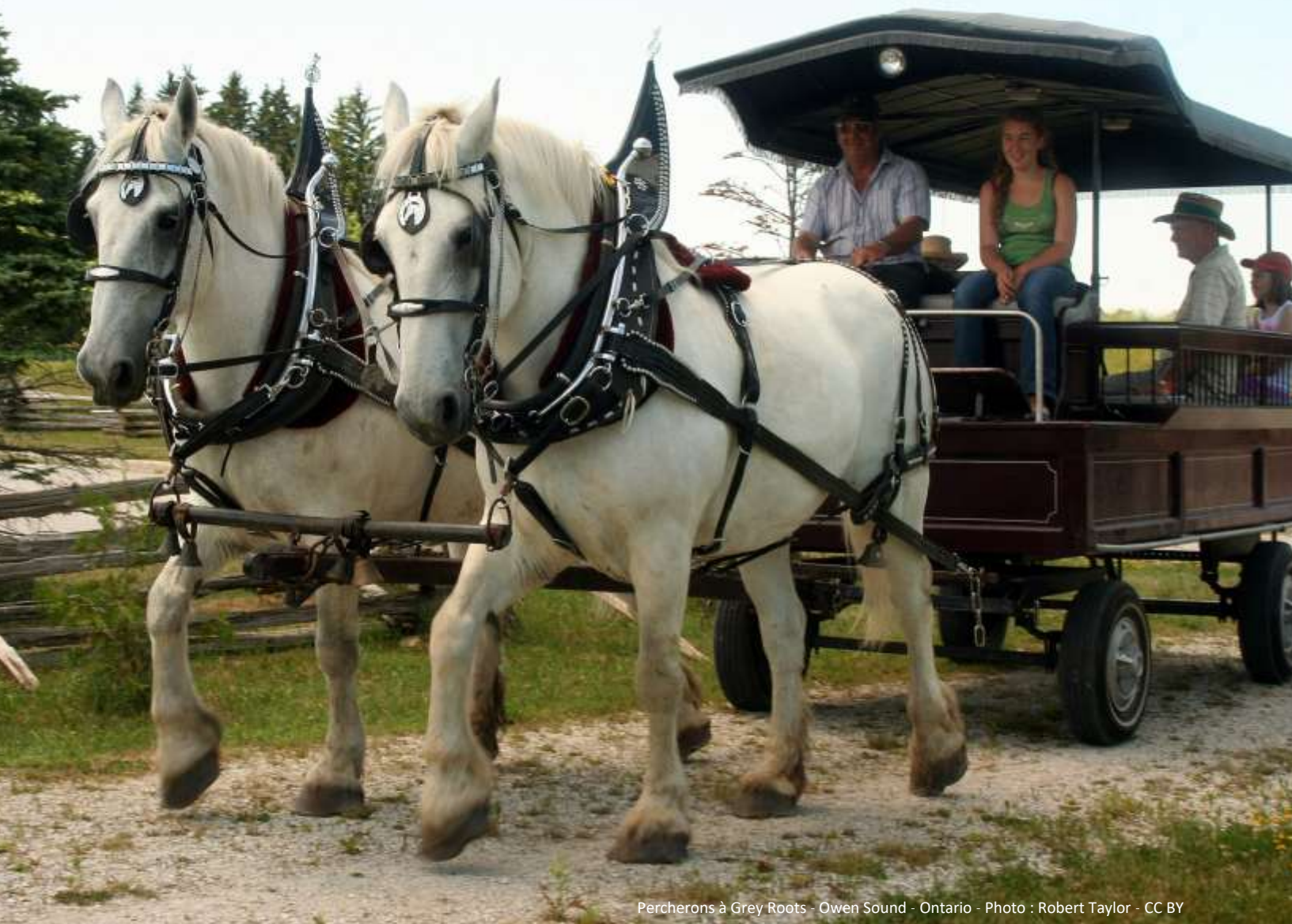
Percherons à Grey Roots - Owen Sound - Ontario