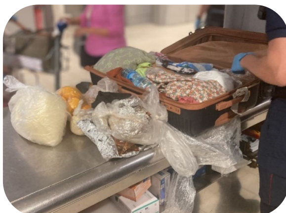
Contrôle douanier d'une valise à l'aéroport Paris-Charles de Gaulle

La commission estime qu'il découle de notre devoir de vigilance face aux menaces sanitaires d'œuvrer par tous les moyens dont dispose la puissance publique à la réduction drastique de l'ampleur du phénomène . Pour ce faire, elle a adopté 18 recommandations visant à orienter les acteurs de la lutte contre ce trafic et refondre en profondeur une action publique lacunaire, qui intervient trop tard, de manière trop peu dissuasive et insuffisamment coordonnée .