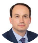
Guillaume Chevrollier Rapporteur Sénateur de la Mayenne (Les Républicains)

Commission de l'aménagement du territoire et du développement durable